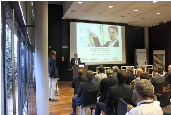
Bild: 1 - "Projekt schaffen Innovation", 29.9.2011

im Namen der Gesellschaft für Projektmanagement –GPMS - begrüße ich Sie ganz herzlich zur ersten Projektmanagement Tagung in Südtirol. Ich freue mich, dass wir heute hier zusammenkommen und ich freue mich besonders über die große Anzahl der Teilnehmenden.